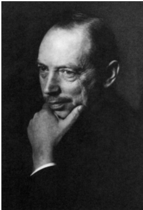
Friedrich Thimme (1868.—1938.)

Njemačka nije bila samo vojnički poražena, nego i politički desetkovana, a psihološki ponižena. U tom svjetlu je i pitanje odgovornosti za svjetski rat (tzv. Kriegsschuldfrage ), napose članak 231. Versailleskoga ugovora, kojim je — nakon naglašenoga francuskog inzistiranja — utvrđena njemačka krivica za njegovo izbijanje, postalo ne samo jedno od ključnih pitanja njemačke vanjske politike, nego i bitan čimbenik unutarnjega društvenog i ideološko-političkog raslojavanja. Njemačka je vlada zbog toga već u srpnju 1919. donijela odluku o pripremanju zbirke dokumenata koja bi rasvijetlila diplomatske i političke aktivnosti uoči Prvoga svjetskog rata. Prvotna vladina nakana, da objavi Bijelu knjigu koja je imala objasniti i opravdati ulogu Njemačkoga Reicha, zaslugom priređivača obuhvatila je ne samo izvorno planirano razdoblje od 1912. naovamo, nego se je protegla sve do vremena osnivanja Reicha, 1871. godine. Slijedom toga pretvorila se u impozantnu zbirku dokumenata o predratnoj politici, koja je pod naslovom Die grosse Politik der Europäischen Kabinette, 1871—1914. Sammlung der diplomatischen Akten des Auswärtigen Amtes im Auftrage des Auswärtigen Amtes ( Visoka politika europskih vlada 1871.—1914. Zbirka diplomatskih dokumenata Ministarstva vanjskih poslova, po ovlasti Ministarstva vanjskih poslova ) objavljena u Berlinu od 1922. do 1927. u 40 knjiga (od čega je čak dvanaest objavljeno u dva sveska). Zbirku su uredili Johannes Lepsius