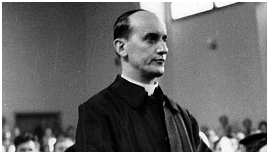
Stepinac: Hrvatski se narod plebiscitarno izjasnio za hrvatsku državu!

A Finkielkrautov mene tekkel ponavlja u – ili im veliki vračevi u usta stavljaju, u biti je svejedno – deseci hrvatskih intelektualaca i kulturnih uglednika. Kako je to moguće? Kako je moguće da kao cijeli narod nosimo stigmatu fašista i potencijalnih koljača, kad imamo na umu tobožnje