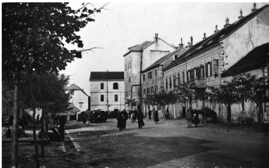
Imotski između svjetskih ratova

Puno manje nedoumica ima oko tzv. logora u Glavini Donjoj koji se, evo, hoće proglasiti logorom o kojem svi šute premda su,