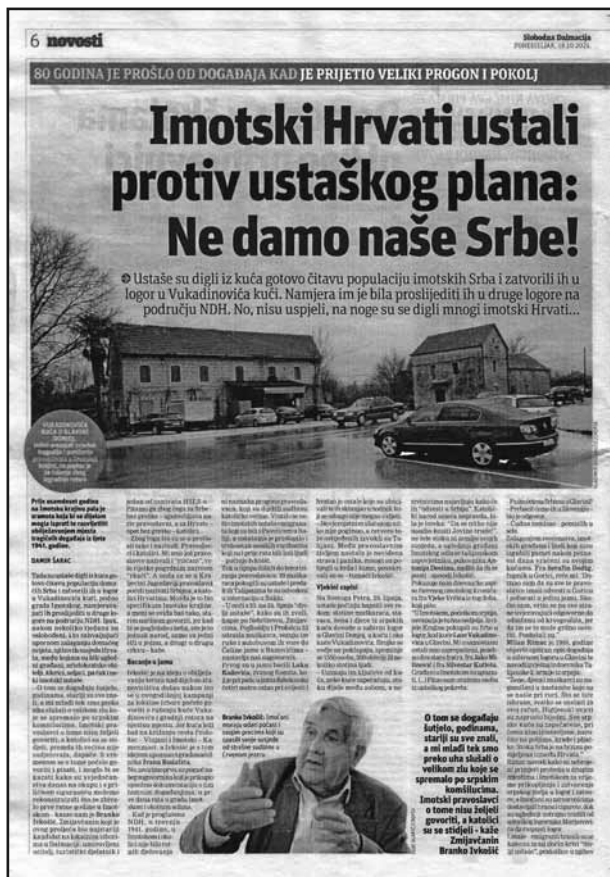
Jugoslavenska politika pod krinkom humanizma

Takvi, razumije se, nisu sudjelovali u onim ubojstvima imotskih Hrvata katolika do kojih je došlo u monarhičkoj Jugoslaviji, a njih – pogotovo onih koja su izvršena na doista zvjerski način – nisu, nažalost, počinili samo doklaćeni jugoslavenski oružnici (žandari), nego i neki mjesni Srbi, uključujući i one koji će domalo vlastitim